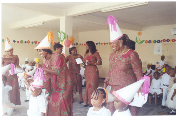
Le jour de 20-12-2007 a lieu la fête de l'arbre de Noël à l'école maternelle et primaire privée laïque de Bonapriso.